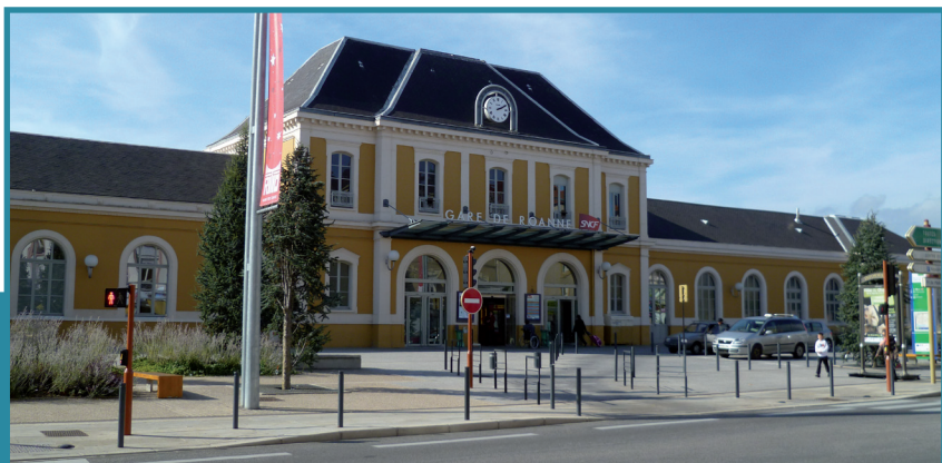
Gare de Roanne

Par ailleurs, la desserte en gare centrale de Roanne, avec électrification et aménagement de la ligne Roanne / Saint Etienne, assure une connexion directe avec la gare de Saint-Etienne avec un gain de 30 minutes de temps de parcours entre cette agglomération de plus de 400 000 habitants et l'Île de France.