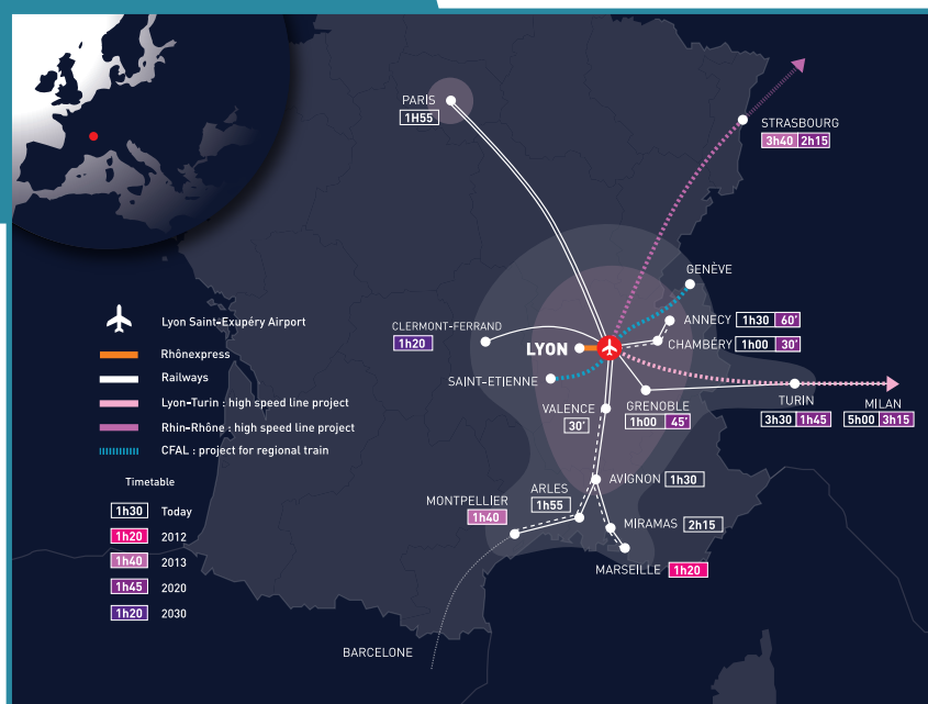
L'aéroport de Lyon-Saint Exupéry et sa desserte ferroviaire

/ Figueras, Paris-Orléans-Clermont-Lyon) vont permettre à la plateforme de renforcer ce trafic et d'être au croisement de lignes est-ouest et nord-sud. Le Contournement Ferroviaire de l'Agglomération Lyonnaise, dont la mise en service est prévue en 2020, reliera la gare de Lyon-Saint Exupéry au rail conventionnel ce qui lui donnera la possibilité d'être desservie par des trains régionaux.