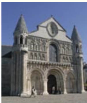
Notre-Dame-La-Grande (Daniel Proux - mairie de Poitiers)