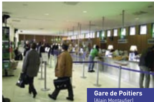
Gare de Poitiers (Alain Montaufier)

L'aménagement du pôle d'échanges multimodal est la première phase du projet de réaménagement du quartier de la gare et s'inscrit dans l'optique de renforcer sa fonction de « hub ferroviaire » pour l'ensemble du Poitou-Charentes. Aussi, il faut renforcer les fonctions de nos gares actuelles si nous souhaitons conserver la valeur ajoutée du ferroviaire qui nous permet d'accéder rapidement dans les centres-villes. Ainsi, le développement des flux avec l'arrivée d'une ligne Poitiers-Limoges renforcera la fonction centrale du pôle multimodal et développera l'activité économique qui a vocation à s'installer dans le nouveau centre d'affaires.