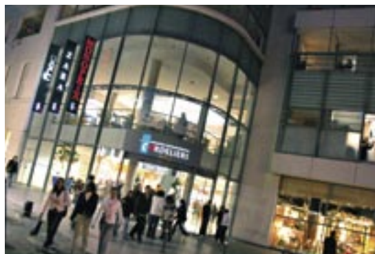
Îlot des Cordeliers (Alain Montaufier)