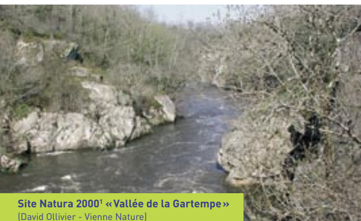
Site Natura 2000 1 « Vallée de la Gartempe » (David Ollivier - Vienne Nature)

Les contraintes techniques inhérentes aux vitesses supérieures à 300 km/h (rayon de courbure et pente principalement) sont incompatibles avec la souplesse que suppose la traversée d'un territoire au relief accusé , creusé de vallées, riche d'un habitat rural dispersé, de paysages remarquables et d'un patrimoine faunistique et floristique à sauvegarder. L'expérience de l'enquête d'Utilité Publique Angoulême-Bordeaux et de l'Avant-Projet Sommaire Tours-Angoulême montre malheureusement que les impératifs techniques interdisent toute modification significative du tracé, une fois le fuseau de 1 000 mètres défini, et que ce fuseau est avant tout déterminé selon des critères de moindre coût (tracé le plus court, peu d'ouvrages d'art, minimisation des déblais...).