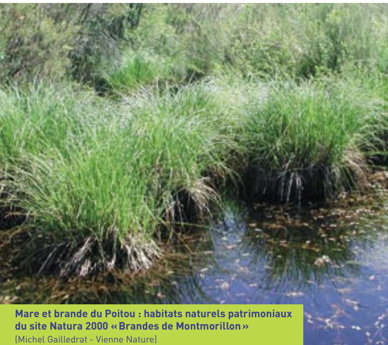
Mare et brande du Poitou : habitats naturels patrimoniaux du site Natura 2000 « Brandes de Montmorillon »

Sans une telle étude, le débat ne pourra pas porter sur la pertinence ou non des projets de type LGV et s'enlisera dans des questions prématurées de tracé.