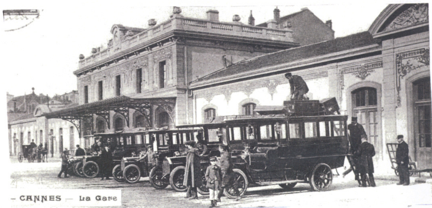
— CANNES — La Gare

Au delà de Nice, ce sont les départements des Alpes Maritimes et du Var qui se trouvent pénalisés par la gourmandise des marseillais.