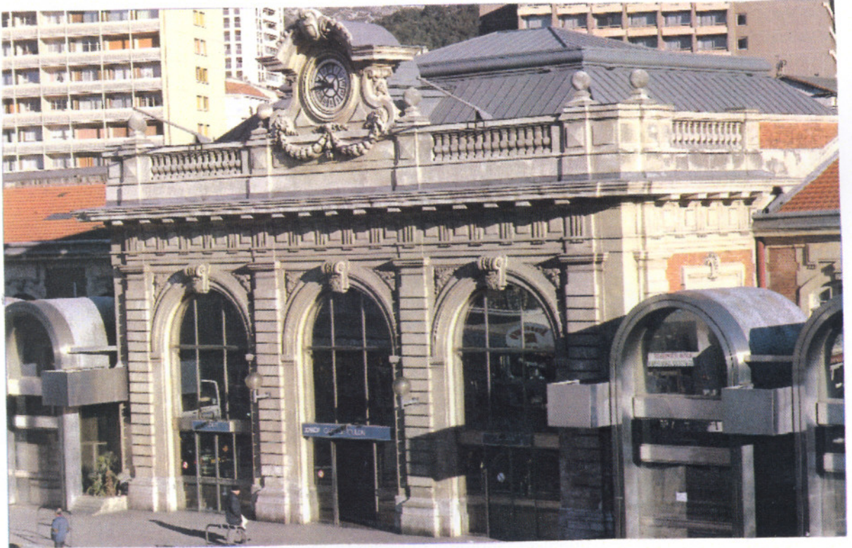
Gare de Toulon