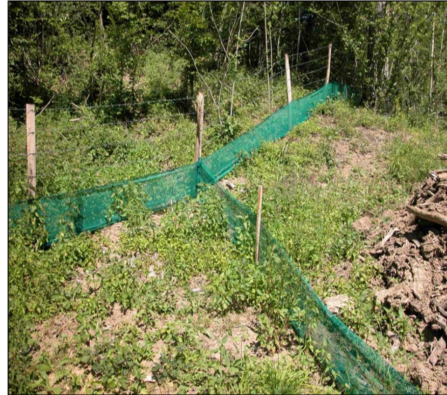
Filet de protection