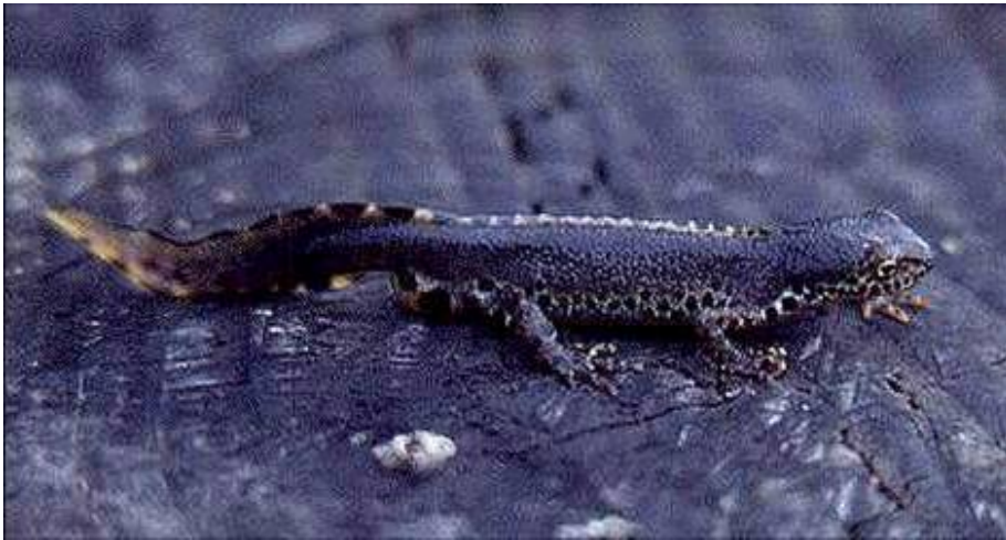
Le Triton Crêté

➤ Présence de quatre espèces protégées de Tritons (crêté, alpestre, ponctué, palmé) et de grenouilles