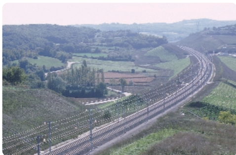
Exemple d'insertion paysagère (site de Chabریان - LGV Méditerranée)

Sur la base des grands principes exposés dans ce schéma directeur, les études d'insertion paysagère seront poursuivies et affinées au stade de l'Avant-Projet Détaillé en concertation avec les acteurs locaux.