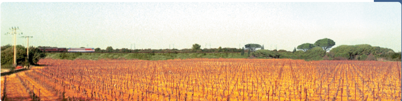
Principe d'insertion paysagère du Contournement de Nîmes et Montpellier (photomontage - secteur de Lattes-Maurin)

Sur la base des grands principes exposés dans ce schéma directeur, les études d'insertion paysagère seront poursuivies et affinées au stade de l'Avant-Projet Détaillé en concertation avec les acteurs locaux.