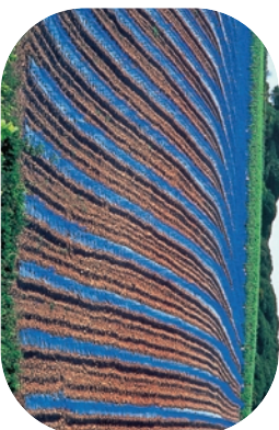
Vignobles en AOC Costières de Nîmes