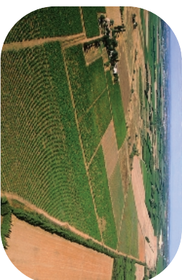
Plaines agricoles entre Vestric-et-Candiac et Nîmes