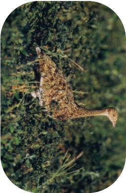
L'Ouzarde canepetière, une espèce rare et protégée