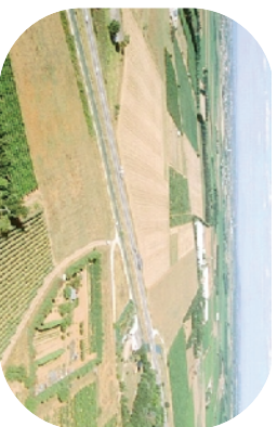
Le canal G et la RN 113 franchis par la ligne