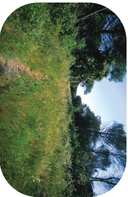
Le Bois de Signan, un espace naturel au sein des plaines agricoles