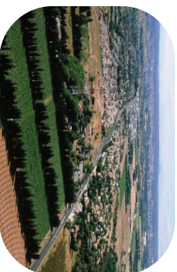
La zone urbanisée de Caissargues