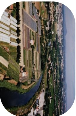
La Cérétière, une zone agricole sensible au risque d'inondation