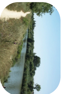
Le Lez, un cours d'eau présentant une large zone inondable