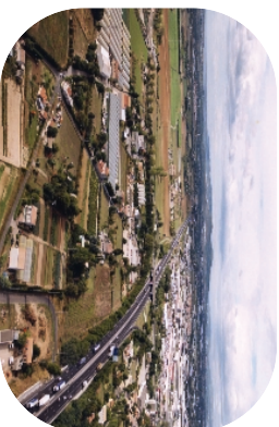
La zone de jumelage des deux infrastructures nouvelles : des espaces urbanisés et des espaces agricoles