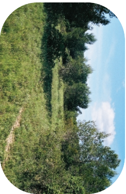
Espaces favorables à l'astragale gréaux ou Mas de Plume