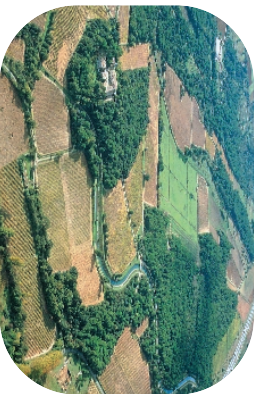
Les collines de Lunel, au niveau de la Tour de Forges