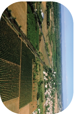
Les abords de Valerques