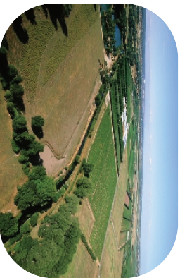
Le Vidourte et la plaine inondable