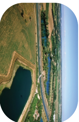
Le canal Philippe Lamour et les gravières du Mas d'Arnaud, affluents de la nappe de la Vistrenque