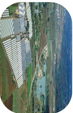
Les serres du Mas des Abeilles, zone agricole sensible au risque d'inondation