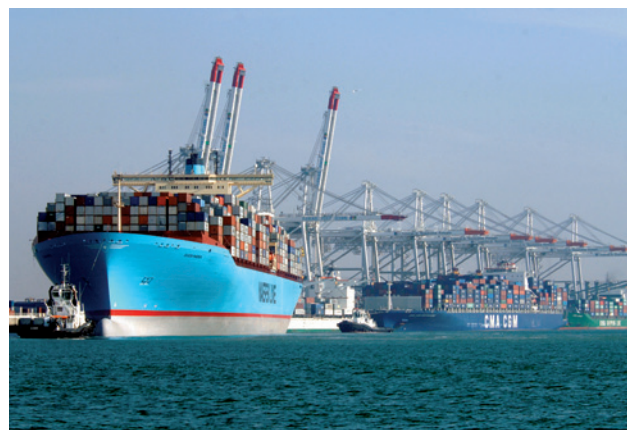
Le Havre est le premier port conteneur français et son potentiel de croissance est considérable.

Le port du Havre, premier port de France pour les conteneurs, qui a sensiblement accru ses capacités depuis l'achèvement des terminaux de Port 2000, celui de Rouen, en pointe sur le trafic céréalier et celui de Paris, dont l'activité fluviale est indispensable à la métropole parisienne, constituent d'ores et déjà un système portuaire parmi les plus puissants d'Europe. En instaurant une étroite collaboration, ils sont en situation de faire face à la concurrence des grands ports européens (Anvers, Rotterdam, Hambourg), qui, de leur côté, ne disposant pas des mêmes réserves de surface que leurs homologues français, doivent consentir des investissements considérables pour assurer leur progression.