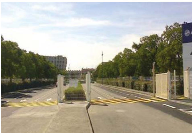
Entrée Site Saint Martin : aménagement Pistes Cyclables

Évènements spécifiques, showroom, affichage, dépliants, enquêtes