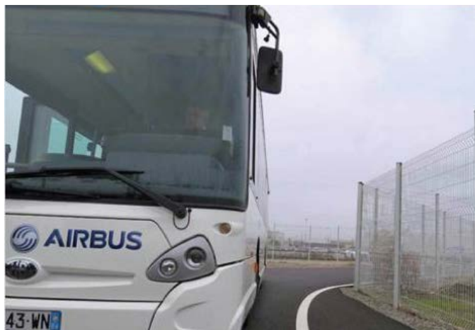
Navette InterSites St Martin / Blagnac