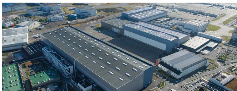
Site Louis Breguet – Colomiers : Chaîne d'Assemblage Final A350

Airbus est le 1 er contributeur privé du SMTC/TISSÉO via son versement transport qui représente 10 % du versement global SMTC.