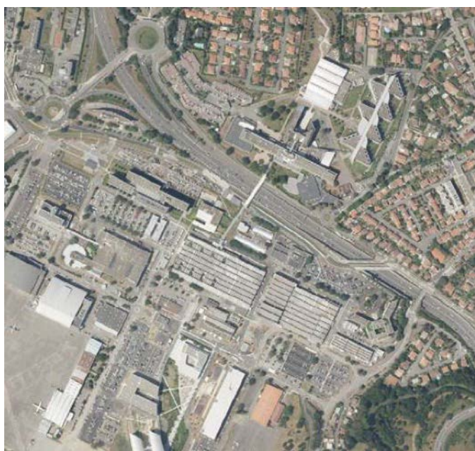
Site de Blagnac

Les collaborateurs d'Airbus étant par milliers à être des usagers réguliers des différentes lignes aériennes, placer une station à l'aéroport est incontournable.