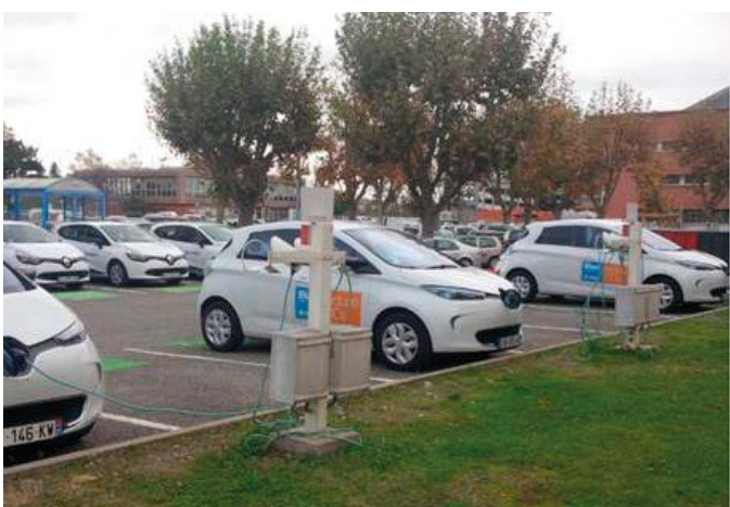
Flotte de véhicules électriques, disponibles en autopartage via Intranet