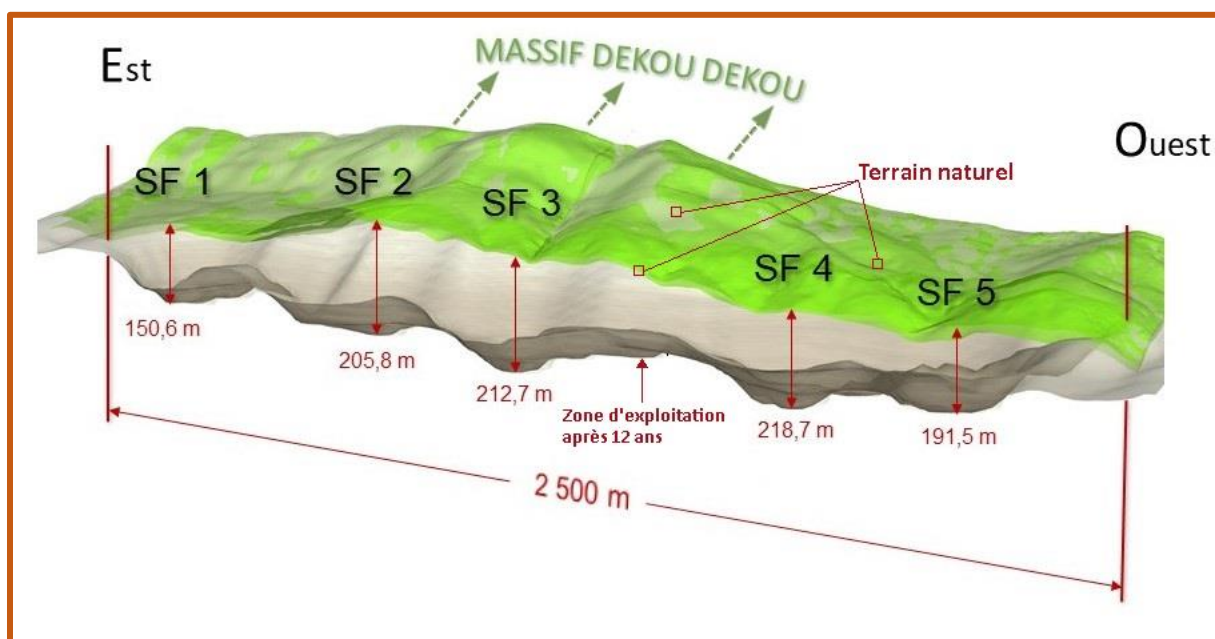
Coupe 3D longitudinale est-ouest de la fosse minière du gisement de Montagne d'Or après 12 ans d'exploitation

La première coupe 3D est-ouest, réalisée à partir du modèle 3D, permet de représenter les différentes sous-fosses sur la longueur de l'exploitation. La surface actuelle, en vert, sur la coupe, sert de référence pour la profondeur de chaque sous-fosse. Là encore, les contreforts du massif du Dékou-Dékou sont visibles au sud de l'exploitation.