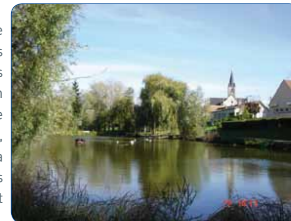
Mare de Grisy

A l'inverse, les élus locaux se prononcent pour le rejet total du scénario N°5 de 4000 tonnes qu'ils jugent irrationnel et irréaliste, avec de nombreuses conséquences négatives sur l'environnement. En outre, il conduirait à une augmentation considérable du débit de la Seine, un risque augmenté de crues, une détérioration importante du territoire de la Commune de Grisy avec la coupure de la boucle et des conséquences non mesurées sur l'environnement et les zones humides.