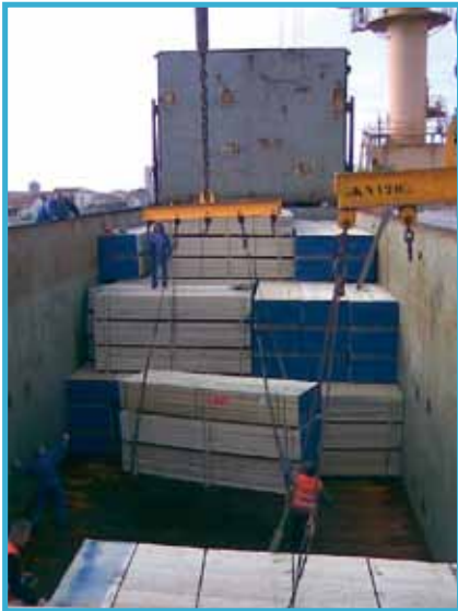
Chargement de fardeaux de bois sciés

Le port de Port-La Nouvelle était au départ confiné à un même linéaire de quai situé à la darse Nord avec deux postes à quai, l'un spécialisé dans les céréales avec un portique de chargement et des silos métalliques en arrière, l'autre équipé de deux grues de six tonnes avec un magasin de 1 000 m 2 , étant entendu que les navires réceptionnés ne pouvaient excéder la centaine de mètres pour un tirant d'eau de 6 mètres.