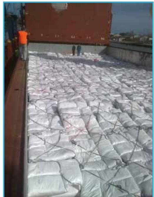
Exportation de farines pré-éluées

Dans ce contexte, il convient de raisonner non seulement par rapport à la concurrence des autres ports mais également en complémentarité des ports de destination ou de provenance, chargeurs ou réceptionnaires devant obligatoirement prendre le plus petit dénominateur commun. Quelques exemples en fonction des tirants d'eau, le port de Port-La Nouvelle est limité à 8 m alors que les ports avec lesquels nous travaillons ont des possibilités plus grandes : Casablanca 12 m, Pointe Noire 14 m, Lobito 12 m, Bejaïa 12 m et Monfalcone 12 m, port enclavé d'Adriatique ayant un projet d'extension de trois postes