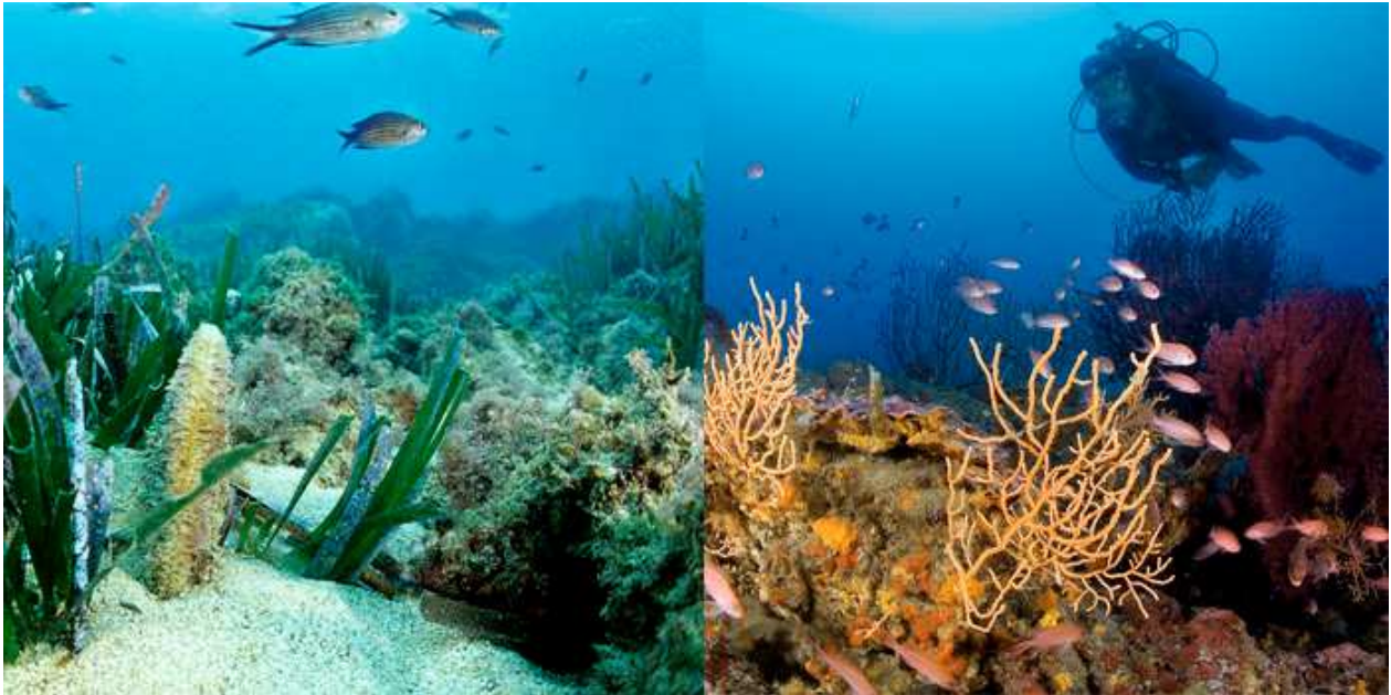
Posidonie, Grande nacre et castagnoles / Plongeur sur coralligène

Cet espace marin est aussi le théâtre d'une histoire et d'une culture maritimes particulièrement riches. Aujourd'hui, il accueille de nombreuses activités professionnelles et de loisirs qui sont en plein essor et en pleine transformation. Par ailleurs, le littoral connaît une très forte croissance démographique, conjuguée à un important développement du tourisme.