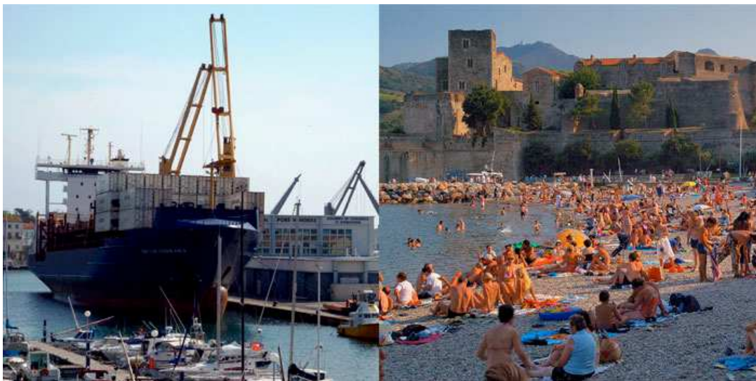
Port de commerce maritime à Port-Vendres / Baignade à Collioure

telle est l'ambition du Parc naturel marin : mobiliser les volontés pour que soit préservé l'avenir de ce morceau de Méditerranée qui abrite tant de richesses et fait vivre tant d'hommes.