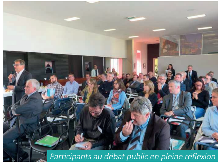
Participants au débat public en pleine réflexion

le groupe devrait investir dans l'installation d'une bande transporteuse de 7km, moyennant 20 millions d'euros (NB : ne prend pas en compte l'ensemble des aménagements complémentaires à la variante Baltique qui seraient nécessaires pour permettre d'accueillir des vraquiers à 22 m de tirant d'eau : dragages, quais à la bonne profondeur, aménagement d'un terminal vrac secs, protection des berges au sud du terminal méthanier soit au total 1 170 M€, contre 689 M€ pour la solution Atlantique), pour acheminer les matières jusqu'à l'usine. Considérant le coût de cette option et son impact sur l'environnement selon elle, le soutien de l'entreprise va au projet Atlantique. Adossé à l'apportement du Quai à Pondéreux Ouest (QPO), Atlantique permettrait aussi de répondre à cette faiblesse, "mais de façon économiquement moins favorable", le groupe étant dans ce cas