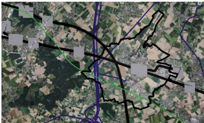
Les infrastructures créent un effet de coupure dans la plaine agricole.

Pour ces raisons, il est fondamental de prendre en considération dès à présent l'activité agricole.