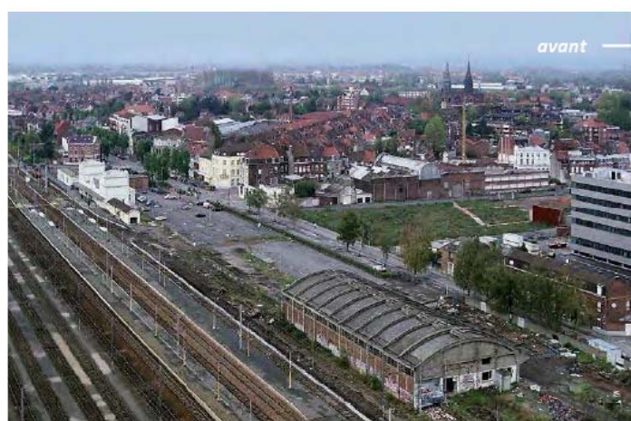
Illustration du réaménagement du quartier de la gare à Armentières avec mise en place d'un parking silo

Le projet prévoit la construction de plusieurs gares ; une gare nécessite obligatoirement des stationnements à proximité. A l'image de plusieurs agglomérations (ex : Nantes ), il apparaît essentiel d'envisager des parkings en forme de silo.