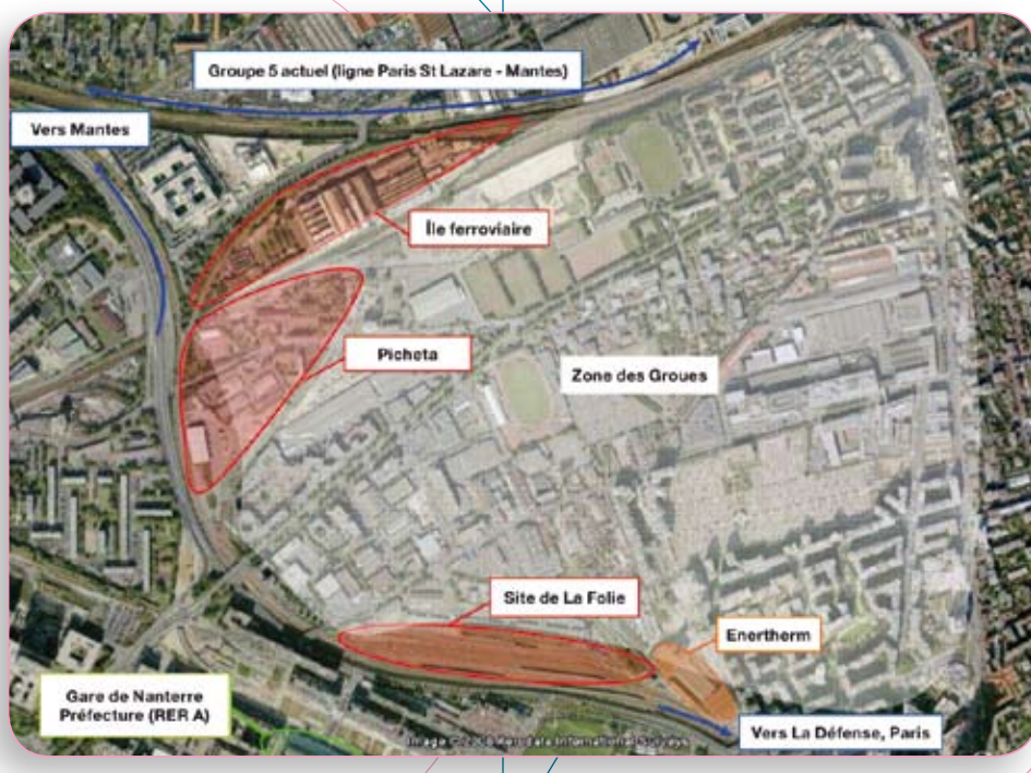
Carte site des Groues à Nanterre