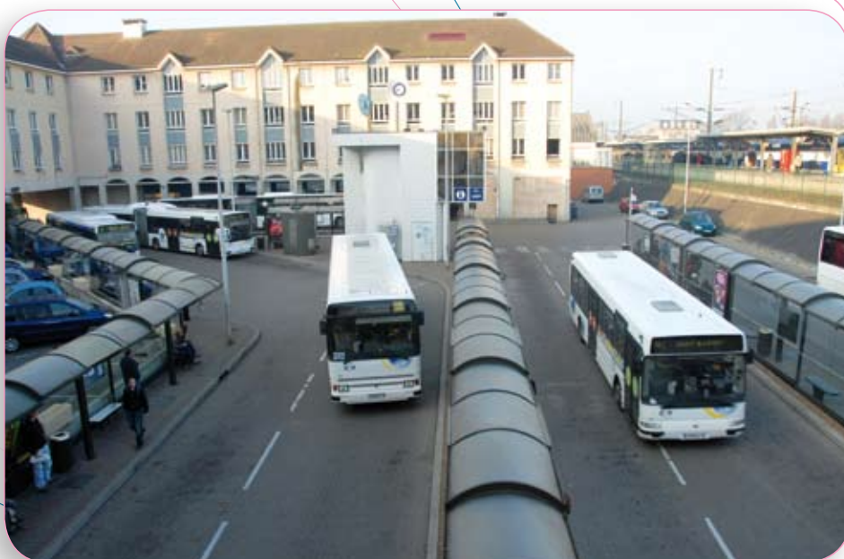
Gare routière de Poissy

Ces voies sont extrêmement chargées, voire saturées aux heures de pointe. Il semble important que des mesures soient prises pour favoriser nettement l'accès à la gare en bus, en particulier depuis les communes proches et notamment Carrières-sous-Poissy, qui vont se développer fortement dans les prochaines années.