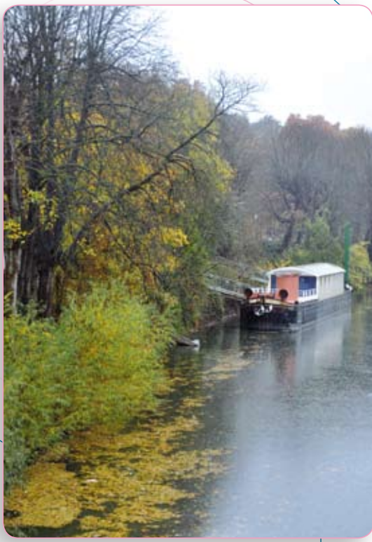
Les berges de Seine

La liaison entre les quais SNCF et les gares routières nord et sud n'offre pas des conditions de sécurité optimales. En vue d'une hausse de trafic, il serait nécessaire de prévoir une amélioration des relations entre les gares routières et la gare, grâce à des aménagements adéquats.