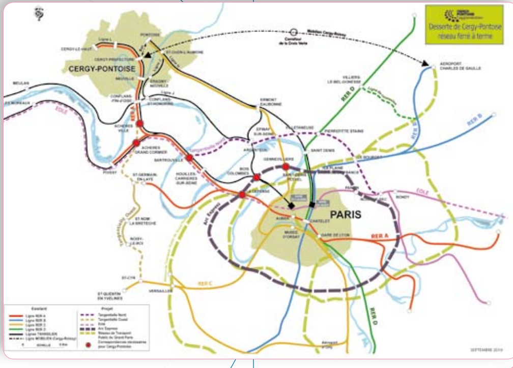
Desserte de Cergy-Pontoise Réseau ferré à terme Septembre 2010