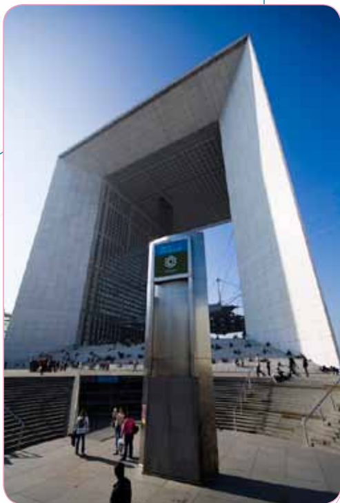
Espace Grande Arche à La Défense

Viparis se prononce en faveur de la réalisation du prolongement de la ligne RER E (Eole) vers l'ouest de la Région Ile-de-France, en passant par le Cnit et la Porte Maillot.