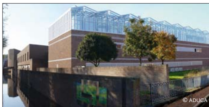
Le laboratoire de la faculté des sciences

l'objectif sera de proposer une offre de recherche et de formation plus cohérente, plus lisible et mieux adaptée aux besoins des territoires. Cette mutualisation des moyens entre les 2 universités pourra être d'autant facilitée avec la ligne directe Amiens-Roissy-Strasbourg.