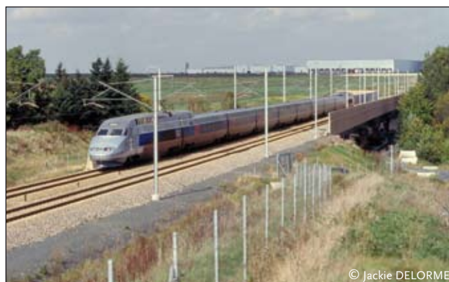
La liaison ferroviaire Roissy-Picardie est une formidable opportunité pour la Somme

Dans tous les cas, ce débat doit permettre l'émergence des meilleures solutions pour le moindre impact sur l'environnement des habitants du Val d'Oise qui supportent déjà les fortes nuisances liées au trafic de l'Aéroport Paris Charles de Gaulle. Il ne s'agit pas d'opposer artificiellement les projets d'implantation du barreau TGV « Roissy-Picardie » et du barreau de Gonesse (raccordant les réseaux R.E.R. D et B). Les deux projets sont importants et complémentaires ; il faut reconnaître leur absolue non concurrence. Le raccordement des RER D et B ne semble pas, compte tenu de son coût estimé, hors de portée d'une réalisation rapide et concomitante du barreau Roissy-Picardie.