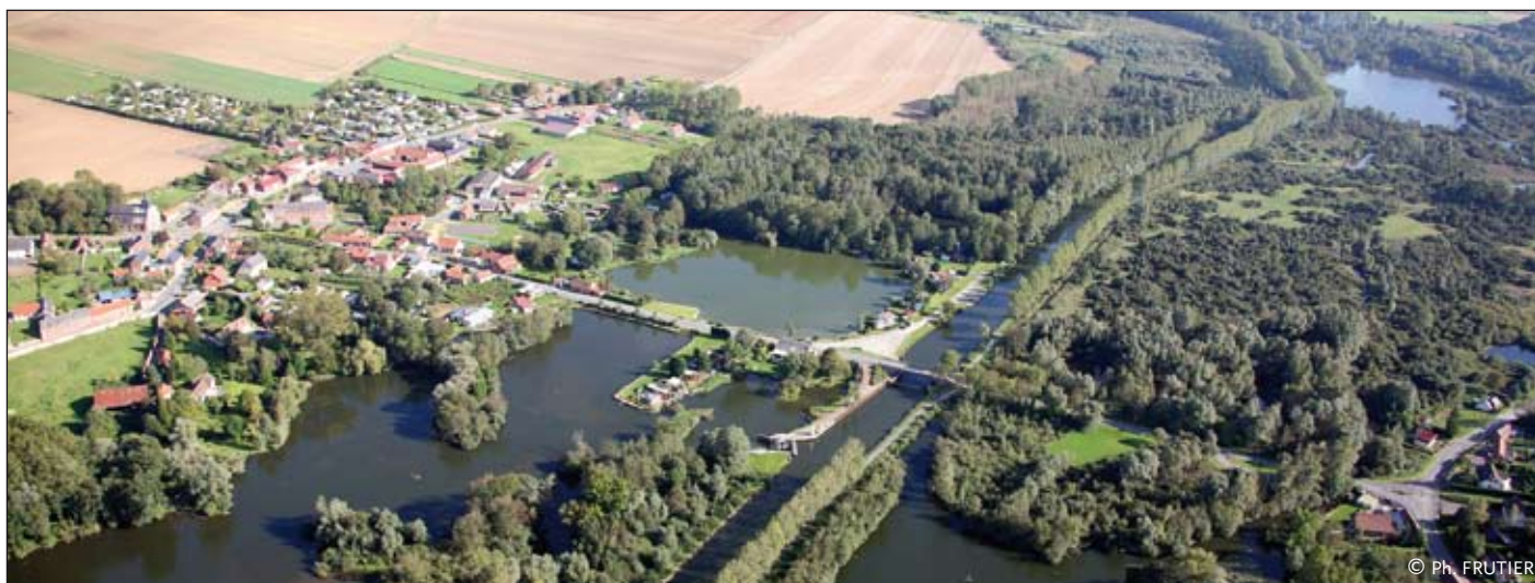
La Somme compte 577499 habitants et 782 communes

Dans le prolongement du vœu que le Conseil général avait adopté à l'unanimité le 18 septembre 2008, toute l'importance accordée à ce projet est réaffirmée comme première étape en direction d'une desserte TGV de la capitale départementale et régionale qui lui est promise depuis la création du TGV Nord :