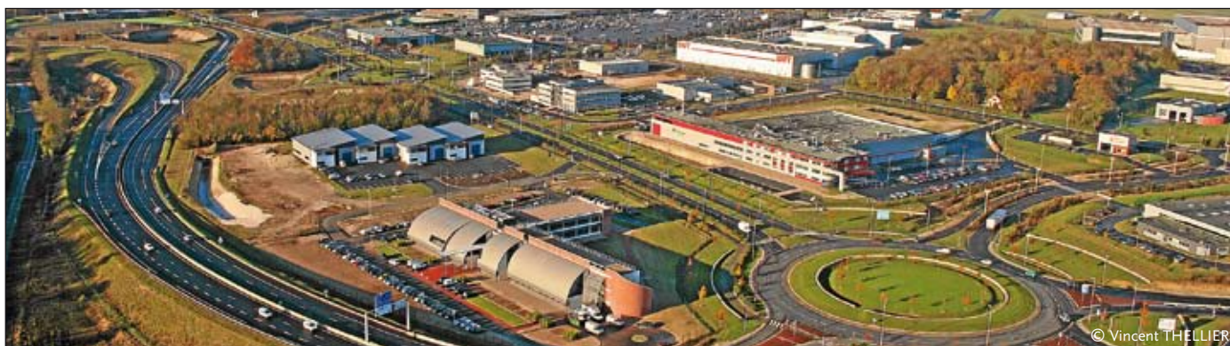
Zone d'activités à une heure de Paris

Ce projet de liaison ferroviaire Roissy-Picardie, également connu sous le nom de « liaison Creil-Roissy », raccorderait en effet à horizon 2020 la ligne classique Amiens-Paris à la ligne à grande vitesse (LGV) d'interconnexion en Ile-de-France, qui dessert la gare « Aéroport Charles de Gaulle TGV ». Il s'agit d'un projet relativement modeste par son ampleur (construction d'un barreau ferroviaire d'environ 7 km, avec divers aménagements de gares et de voies existantes, pour un coût total estimé à 255 M€ HT valeur 2008), mais dont les effets seraient considérables pour le développement socio-économique d'Amiens, du département de la Somme et de toute la Picardie.