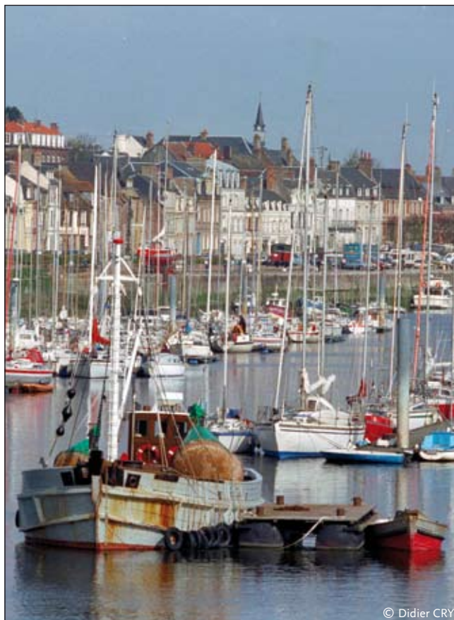
Saint-Valéry-sur-Somme en Baie de Somme

- Enfin, les délais prévus pour faire aboutir ce projet semblent fort longs. Même si son aboutissement exige une transformation de la gare « Aéroport Charles de Gaulle TGV », l'horizon 2020 apparaît