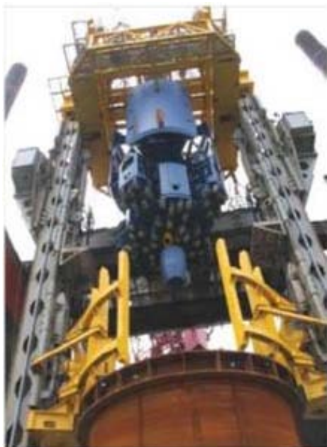
Forage en mer 6,8m de diamètre, chantier EDF