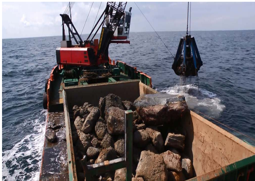
Chantier Dong Energy

Restitution des études en cours par le maitre d'ouvrage fin 2013