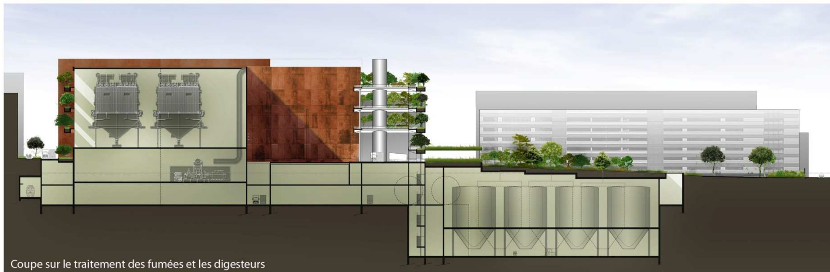
Coupe sur le traitement des fumées et les digesteurs

- Une plateforme, base de la logistique et des équipements de l'usine, en infrastructure à la cote -11.00, permet de libérer les espaces en superstructure pour la création d'une voirie nouvelle au gabarit de 22 m et des jardins entre Ivry et l'usine.