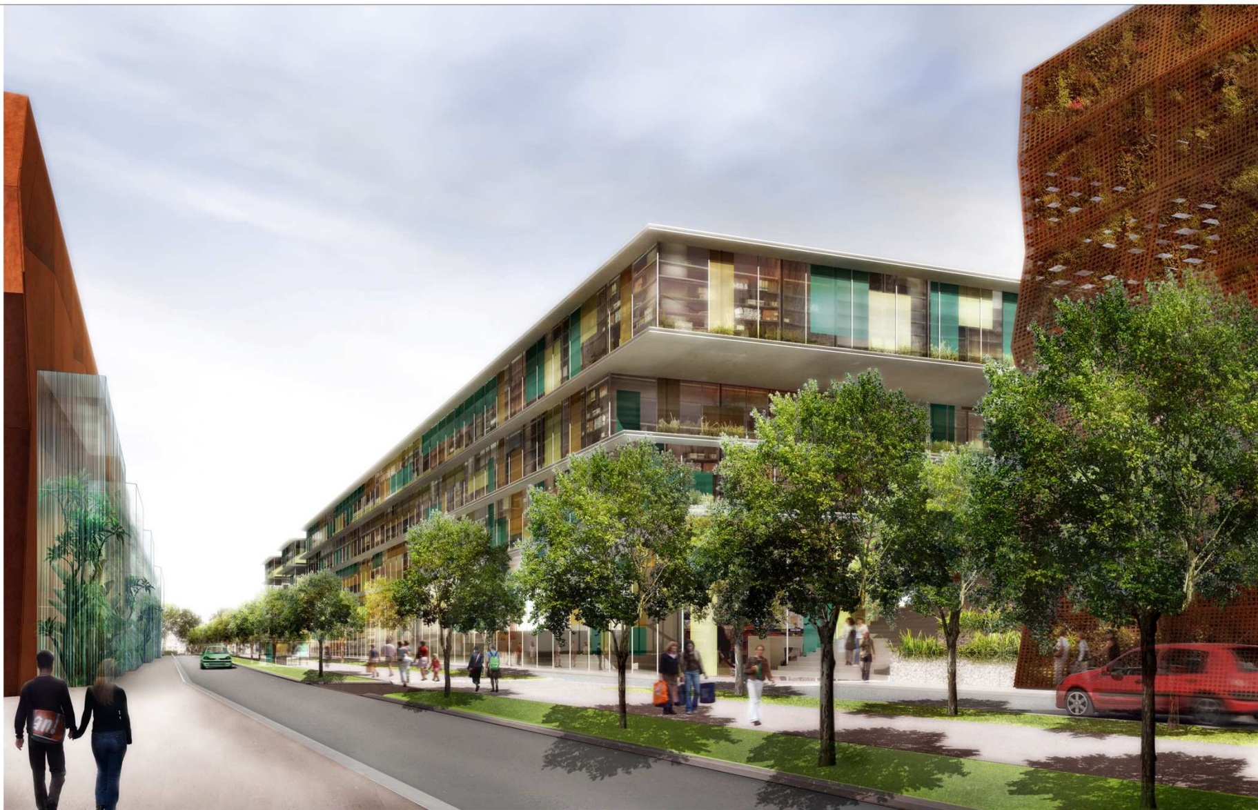
La nouvelle rue, le mail central, les bureaux du Sycotom