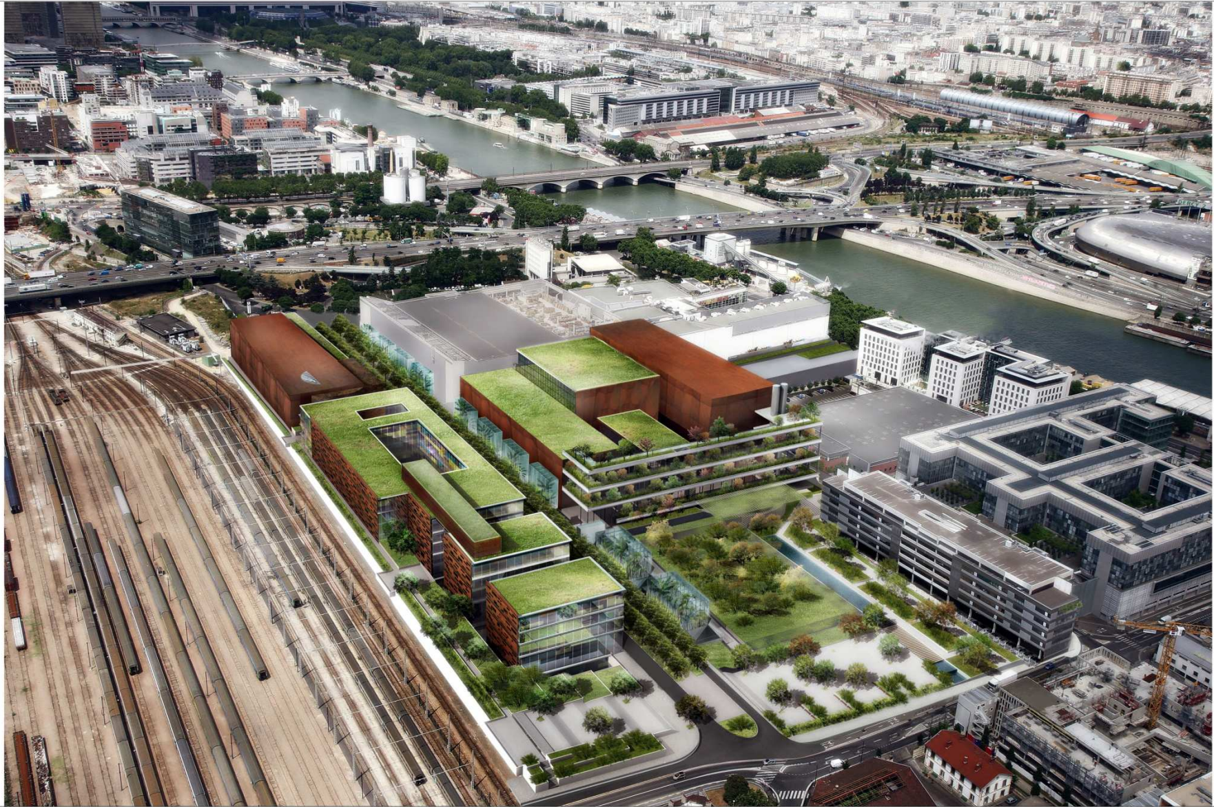
Les îlots, les jardins, les espaces tampons entre l'usine et Ivry