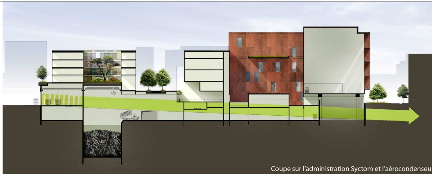
Coupe sur l'administration Syctom et l'aérocondenseur