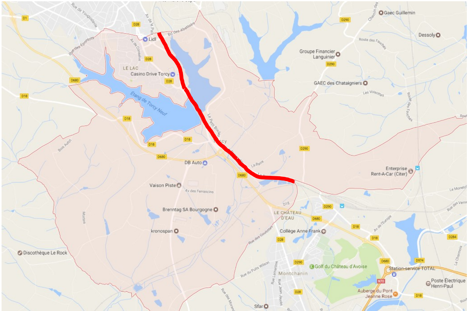
pont de la gare de Montchanin

La voie ferrée Nevers-Chagny traverse la commune de Torcy du pont de la gare de Montchanin jusqu'au boulevard des abattoirs Le Creusot